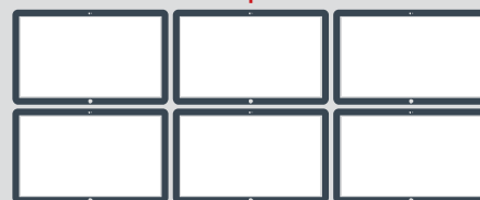
Istituti di Vigilanza